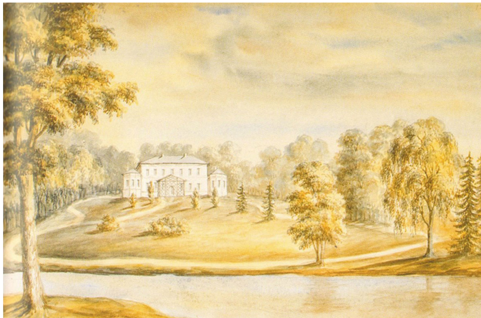
Stańkawa, Pałac Czapskich. Twórca akwareli: Napoleon Orda (1807-1883), polski i białoruski rysownik, malarz, pianista i kompozytor; https://pl.wikipedia.org/wiki/Sta%C5%84kawa