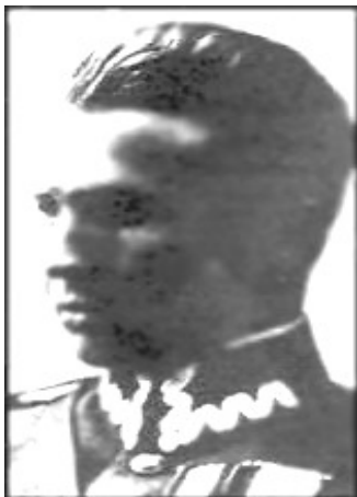
Szef Sztabu Armii Polskiej w ZSRR – gen. bryg. Leopold Okulicki (właściwie Kicka)

Urodził się 12 listopada 1898 r. w Okulicach koło Bochni. Uczęszczał do bocheńskiego gimnazjum. Od maja 1913 roku należał do Związku Strzeleckiego. Następnie służył w 3 pułku piechoty Legionów. Po kryzysie przysięgowym wcielony do armii austro-węgierskiej.